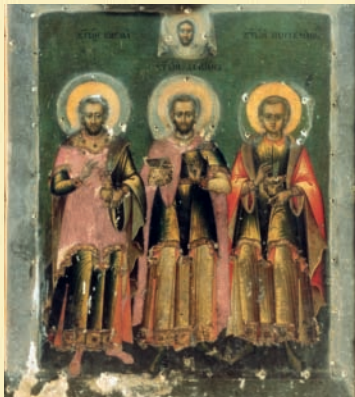
Umkreis Usakow: „Die drei Heiligen Ärzte“ vor und nach Restaurierung